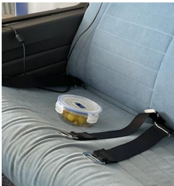
“Gamelle” laissée dans l’avion preuve que le nettoyage “covid” n’a pas été fait !