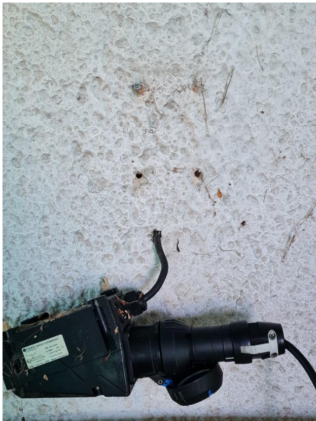
Prise électrique de la pompe SP 95 arrachée et non signalée